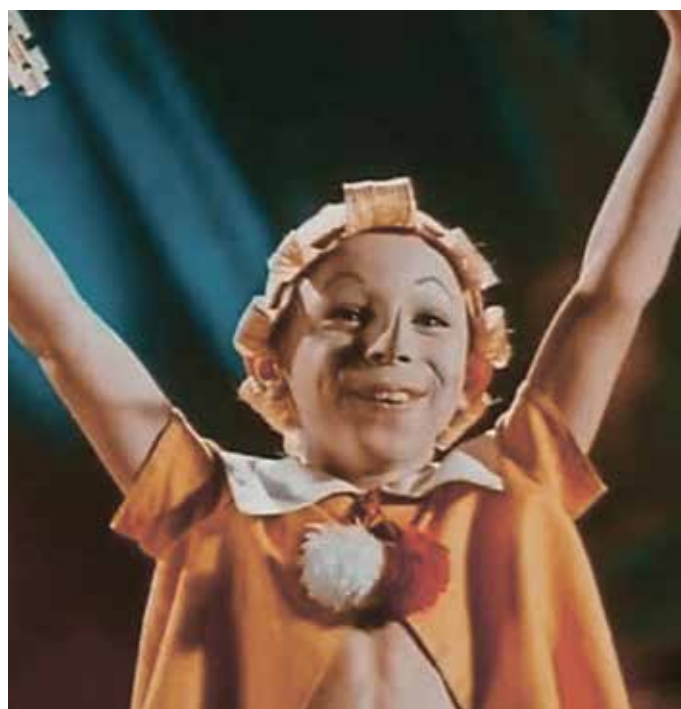
"Приключения Буратино", 1976 г.

Подробный алгоритм действий, показывающий, каким образом любой родитель или педагог может принять участие в программе "Кино-уроки в школах России", опубликован на сайте проекта. При этом сами фильмы были рассмотрены экспертами "Института изучения детства, семьи и воспитания Российской академии образования" и получили положительное заключение, вся необходимая документация также представлена на ресурсе. Со своей стороны, желаем проекту "Кино-уроки в школах России" дальнейшего развития и призываем наших читателей и зрителей по мере сил участвовать в нём, вовлекая детей в созидательную общественную деятельность и знакомя их с полезными для нравственного воспитания фильмами.