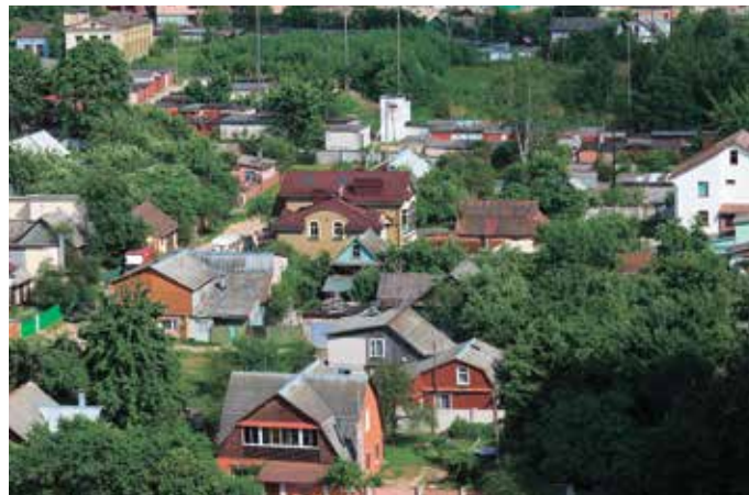
Частный сектор, г. Минск

В результате организации пространства при умонастроении жертвы мы имеем сумбурную застройку частного сектора, особенно его