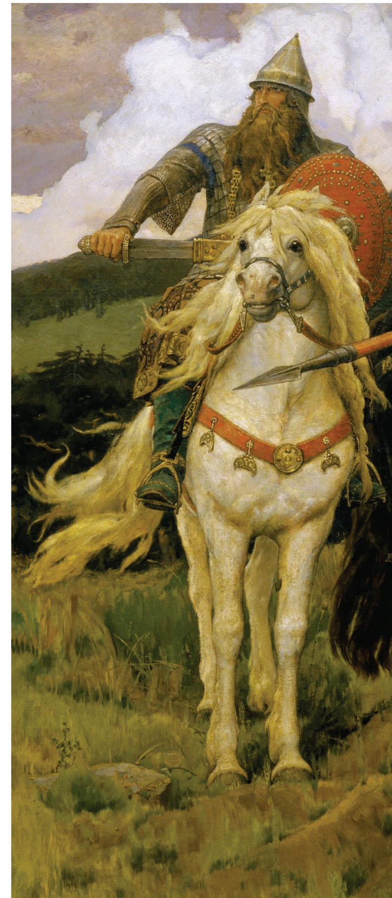
Добрыня Никитич фрагмент картины В. М. Васнецова

Налетел Горыныч-змея на Добрыню, огнём из тридцати голов поплёвывает, дымом смрадным попыхивает.