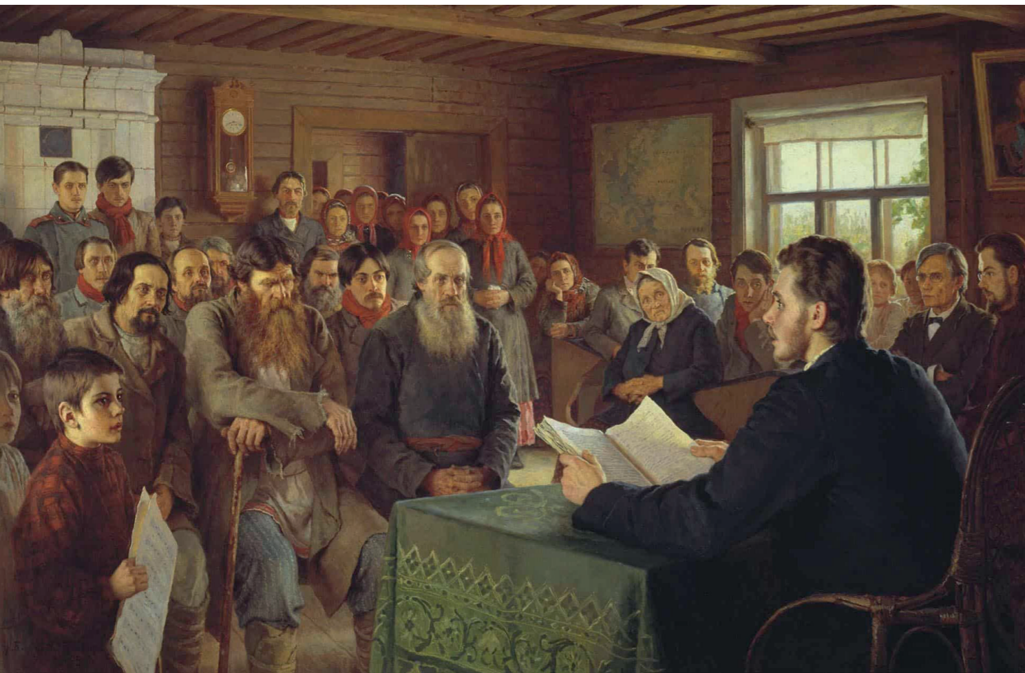
Н. Богданов-Бельский Воскресное чтение в сельской школе

сплотить общину, но настроить их личные вибрации на одну волну. И эта общность, единение людей, и было самым главным смыслом круговой поруки, хотя её экономическую и организационную часть также никто не отвергает.